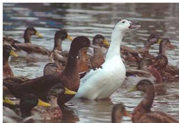
Vítězná fotografie Každý jsme jiný, všichni rovnoprávní